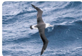
海風に乗って飛ぶコアホウドリ

翼、くちばし、あしなど、鳥の種類によってちがう体の様子をじっくりと見ることができます。また、鳥が生きてするための「びっくり行動」のヒミツも知ることができます。