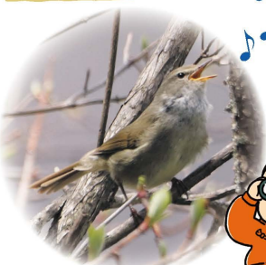
さえざるウグイス