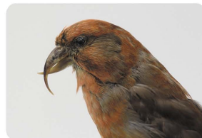
イスカの交差したくちばし、どう使うの?