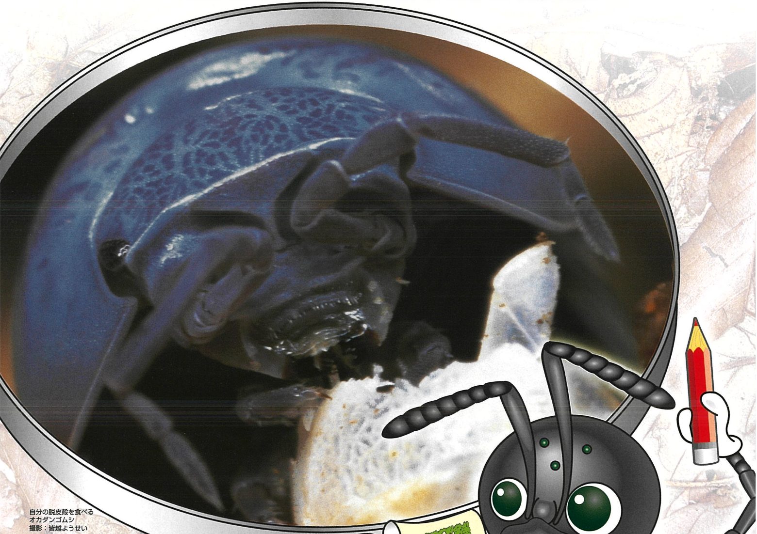
自分の脱皮殻を食べる オカダンゴムシ

土の中の生きものを探せ！ The Adventure in Search of Soil Creatures!