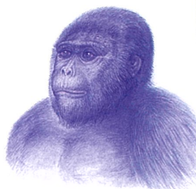
ケニアで新しく発見された 約1000万年前の類人猿の 下あごの骨(上 所蔵:中務真人)とその 復元図(左 イラスト:富田武子) ヒト、チンパンジー、ゴリラの共通祖先 と考えられる。