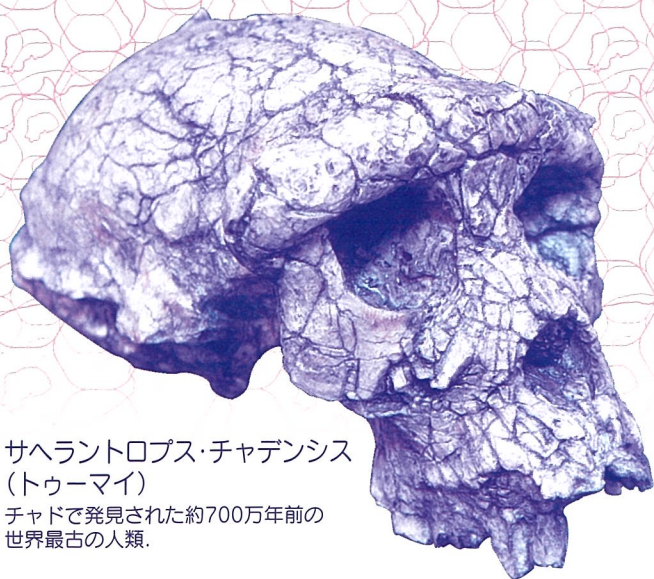
サヘラントロプス・チャデンシス (トゥーマイ)