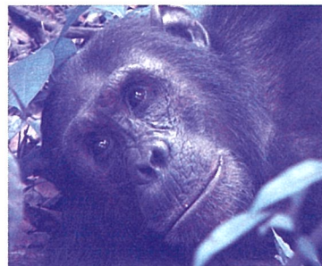
チンパンジー チンパンジーの生態や知能を調べ、ヒトの起源を探ろうとする研究が進められている。