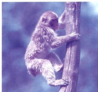
木登りをするニホンザル