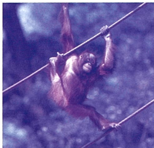
つなわりをする オランウータン