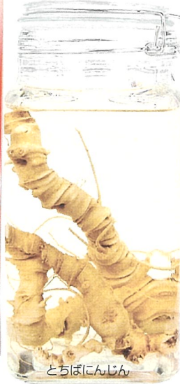
とちばんにんじん