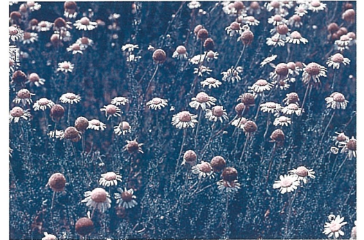
リラックスなどの効果があるローマカミツレ

一般にお茶や香りを楽しむハーブも、ヨーロッパなどの生活に古くから根づいている民間薬です。最近では、植物の芳香成分を利用して、心身をリラックスさせ自己治癒力を高めるアロマセラピーも話題をよんでいます。