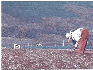
ミシマサイコの栽培 (八郷町)

一般にお茶や香りを楽しむハーブも、ヨーロッパなどの生活に古くから根づいている民間薬です。最近では、植物の芳香成分を利用して、心身をリラックスさせ自己治癒力を高めるアロマセラピーも話題をよんでいます。