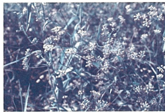
漢方薬によく使われるミシマサイコ