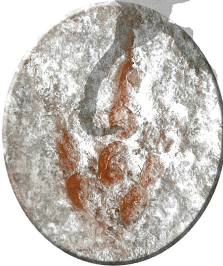
●カルノサウルス類の足跡化石 中国内蒙古自治区でみつかった約1億年前の肉食恐竜の足跡。