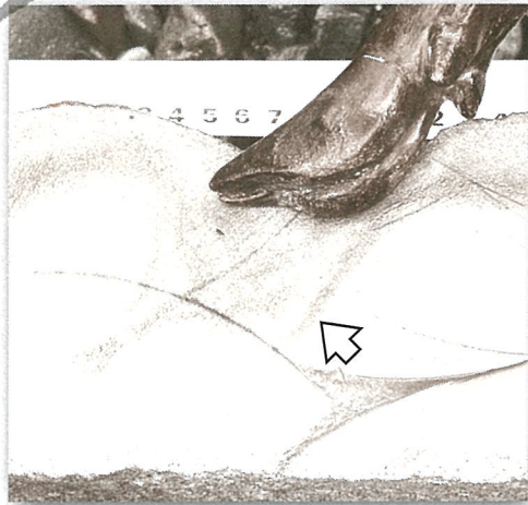
●偶蹄類足跡化石 (矢印) 茨城県大子町でみつかった約1600万年前に生息していたシカのなかまの足跡。