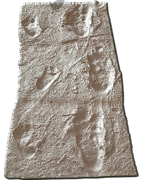
●アファール猿人の足跡化石 タンザニアでみつかった約360万年前に人類が残した足跡。