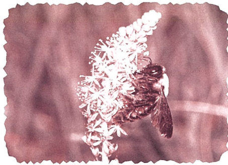
ハナバチの一種 クマバチ