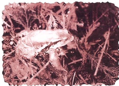
アズマヒキガエル(四六のガマ)