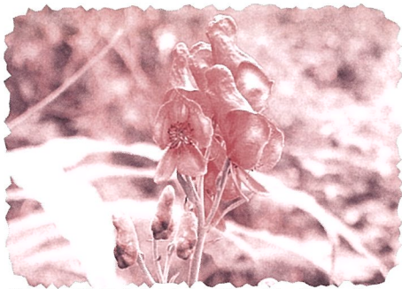
筑波山で発見命名された植物 ツクバトリカブト