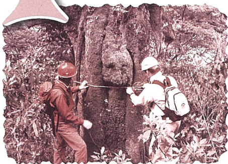
ブナ林調査の様子