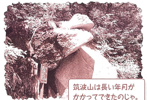
奇岩の一つ ガマ石