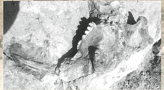
常陸大宮市で発見されたステゴロフォドン