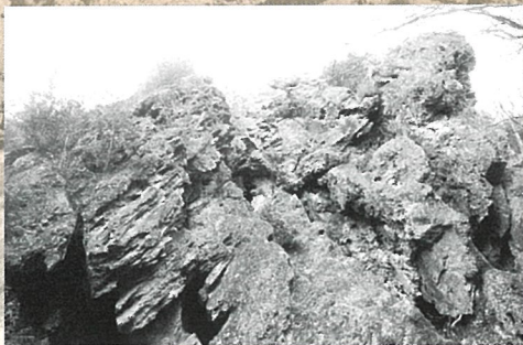
御岩山-5億年前の地層-

茨 城県には日本で最も古い地層があり、大地の起源は約5億年前にまでさかのぼることができます。また、有名な景勝地である筑波山や袋田の滝などの美しい景観は、その大地の成り立ちと大きくかかわっています。そして、平磯海岸の岩礁でみられるアンモナイト、五浦海岸で発見されたムカシオオホホジロザメ、常陸大宮市で最近発見された古代ゾウのステゴロフォドン、つくば市から土浦市を流れる花室川などを中心に数多く発見されているナウマンゾウなどの貴重な化石も、茨城の大地を語るうえでは欠かせないものです。2011年には茨城県北ジオパークが日本ジオパークに公式認定されるなど、茨城県内の各地でみられる多様な地質がもつ意義は、広く認められつつあります。