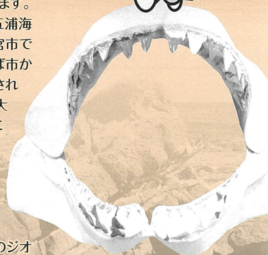
五浦海岸で発見された ムカシオオホホジロザメの 化石から復元された顎