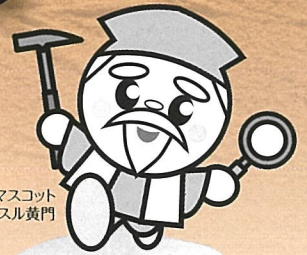
茨城県マスコット ハッスル黄門

本企画展では、悠久の時をたどりながら茨城県内の各地の地質の見所を次々とめぐっていきます。化石や岩石に残された記録をひもときながら茨城のジオ(大地)に目を向け、その成り立ちについて考えていきましょう。