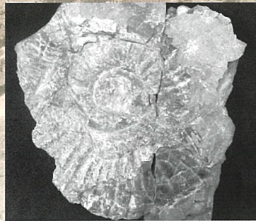
平磯海岸で発見されたアンモナイト