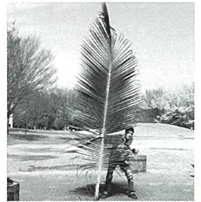
大きな葉っぱ コロヤシ