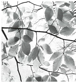
若葉の美しいブナの葉っぱ