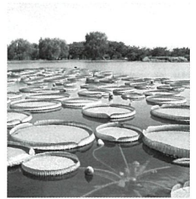
オオオニバス