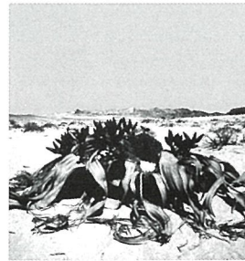
キソウテンガイ