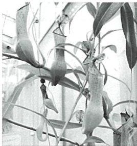
食虫植物 ウツボカズラ