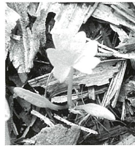
エキサイゼリの芽生え