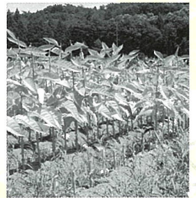
水府葉の畑