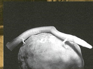
ホライモリ