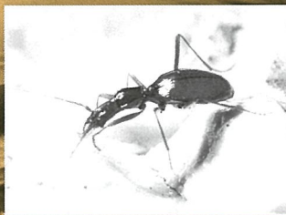
アシナガチビゴミシ