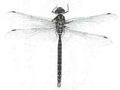
オオルリボシヤンマ