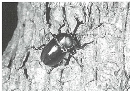
カブトムシなど生き虫を展示します