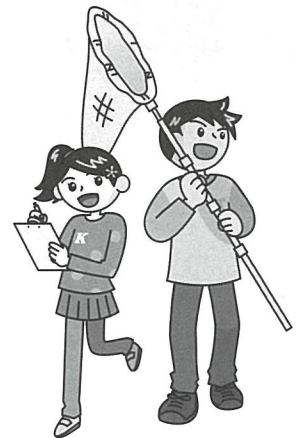
昆虫大研究プロジェクトのナビゲーター 左:ケイ(小5) 右:タケル(中3)