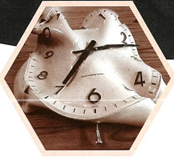
火砕サージで溶けた小学校の時計 (所蔵:南島原市立大野木場小学校)