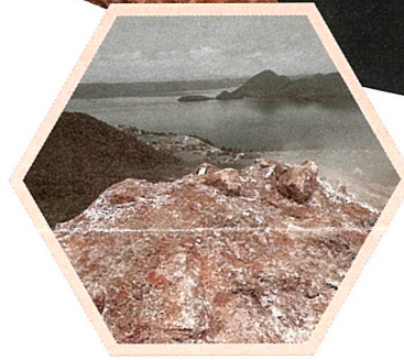
昭和新山の山頂と眼下に広がる洞爺カルデラ

この企画展では、火山列島・日本に生きる私たちが火山を理解し、共生していく道について考えます。