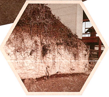
赤城火山からの軽石層(厚さ1m)を含む関東ローム層