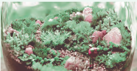
コケのテラリウム