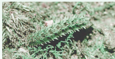
ミカドシリプトガガンボの幼虫