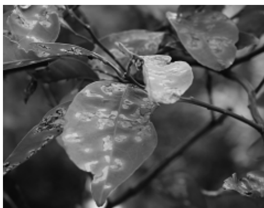
図1. 牛久市で採集したカラタチトビハムシ (左) とナツミカン葉の食痕 (右)。

Fig. 1. Adult of Podagricomela weisei collected in Ushiku City, Ibaraki (left), and food marks on leaves of Citrus natsudaidai (right).