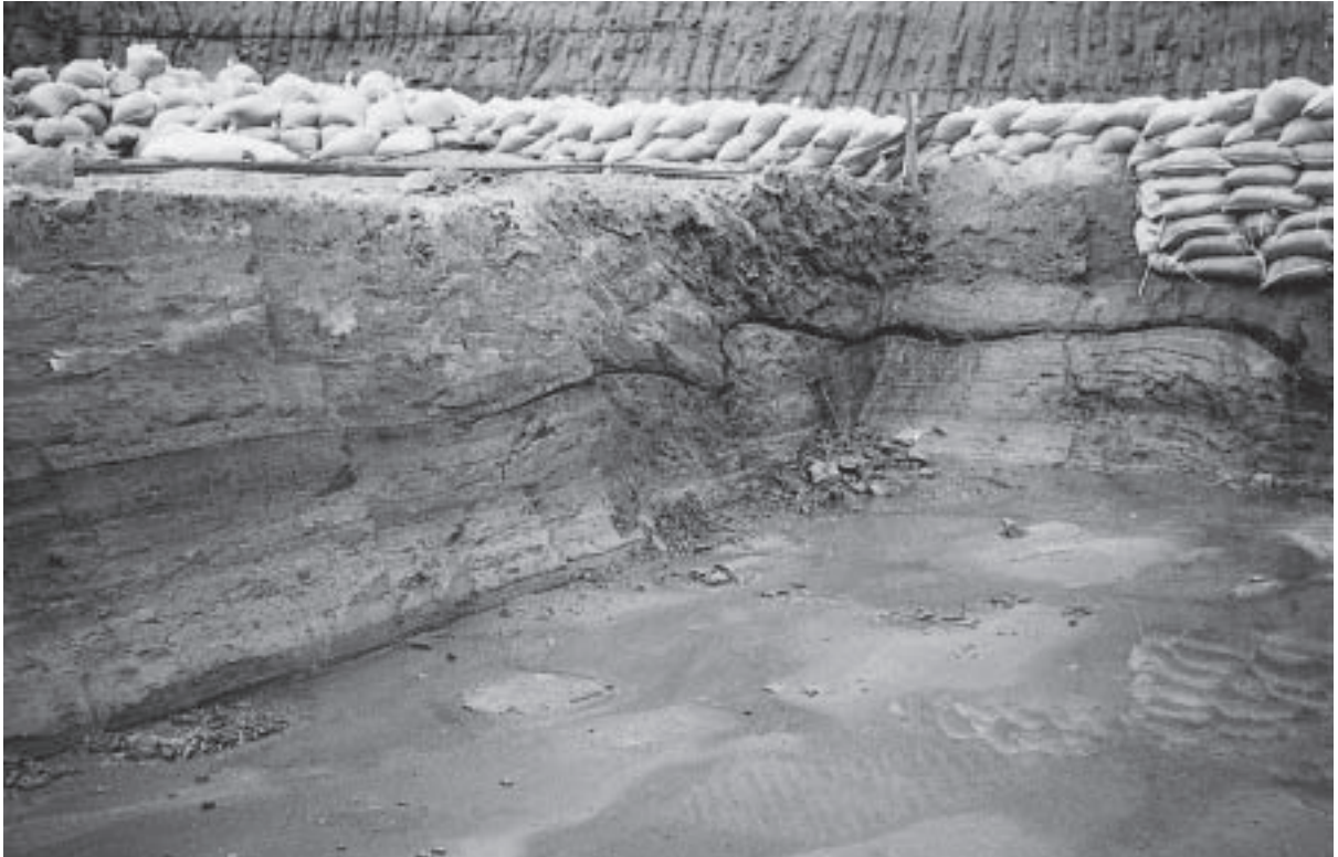
図3. 試料(東海川根2)採取露頭。東海村川根の平原工業団地造成工事に伴う久米層露頭。中部の黒色部は砂岩層でスランプ構造を示す。試料は、直上の青灰色凝灰質砂質泥岩から採取。