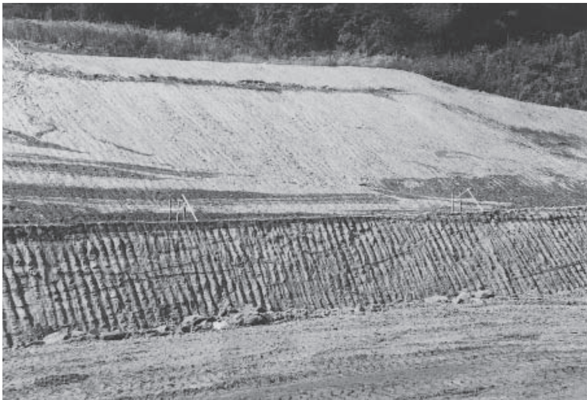
図2. 試料（佐竹南台2）採取露頭．常陸太田市天神林町の佐竹南台ニュータウン造成工事に伴う造成地北部の久米層露頭．試料は下部の青灰色凝灰質砂質泥岩から採取．

4地点6試料からの産出した底生有孔虫の産出状況を付表1および図版1，2に示す．これらから堆積深度について考察する．