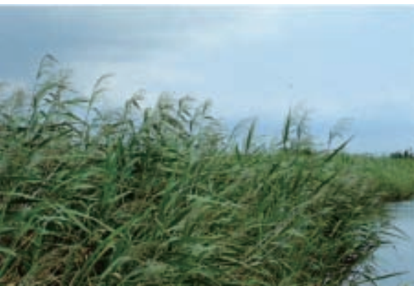
湖畔のヨシ群落 (土浦市) Phragmites australis