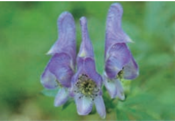
ツクバトリカブト Aconitum tsukubense