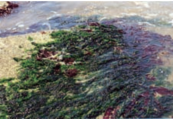
ナガアオサ Ulva arasakii