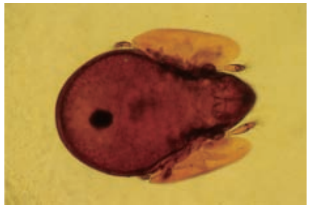
フクロフリソデダニ Neoribates roubali