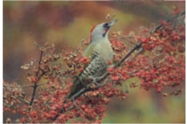
アオゲラ Picus awokera (筑波山)