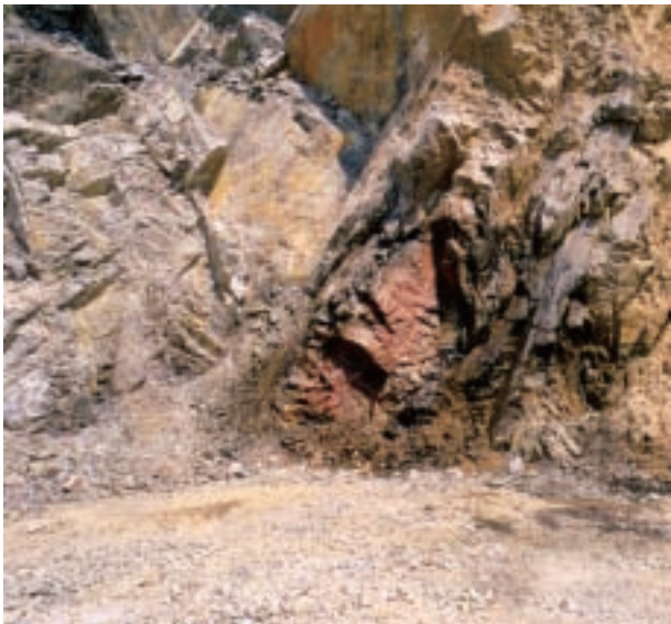
八溝層群中の層状マンガン鉱床 (岩間町上郷 霞工業採石場)