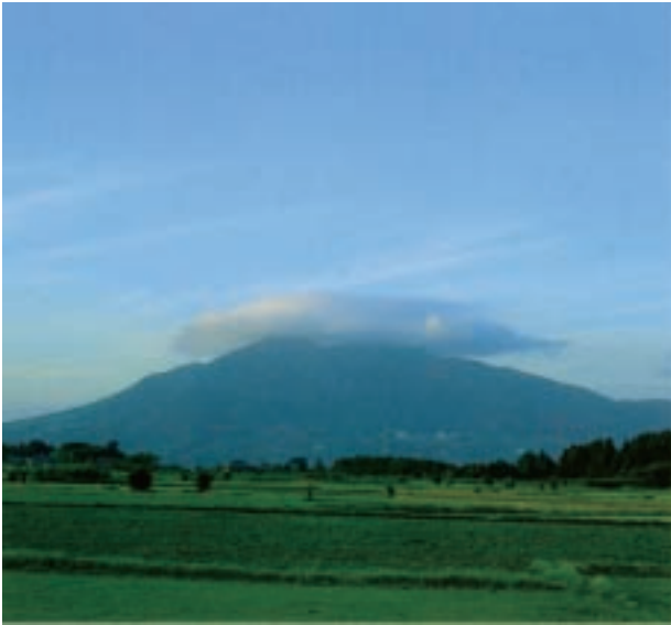
鏡波山にかかる笠雲 (つくば市)