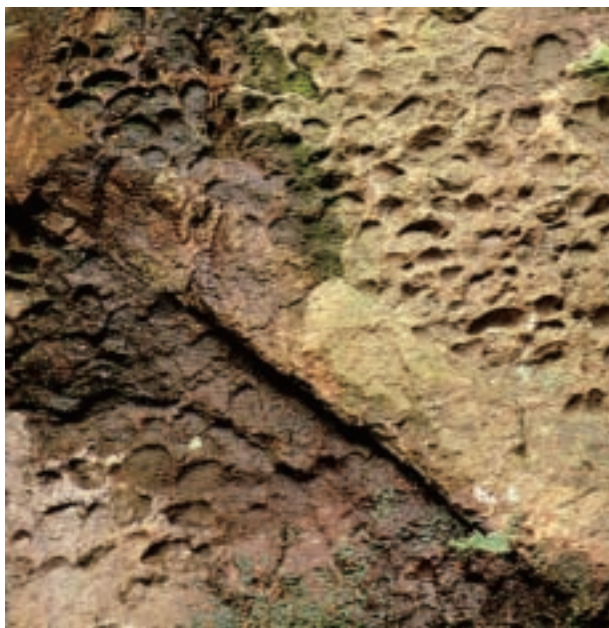
球状花崗岩 (八郷町)