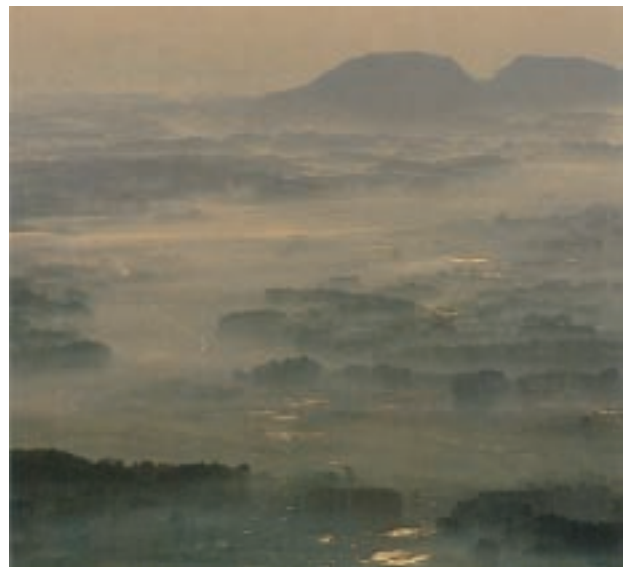
八郷盆地の霧 (八郷町)