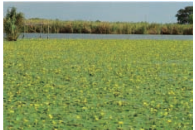
アサザ群落 (美浦村) Nymphoides peltata