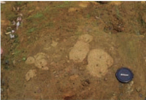
チクワ状生痕化石