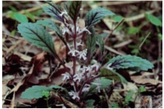
ツクバキンモンソウ Ajuga yesoensis var. tsukubana