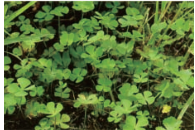
デンジソウ Marsilea quadrifolia