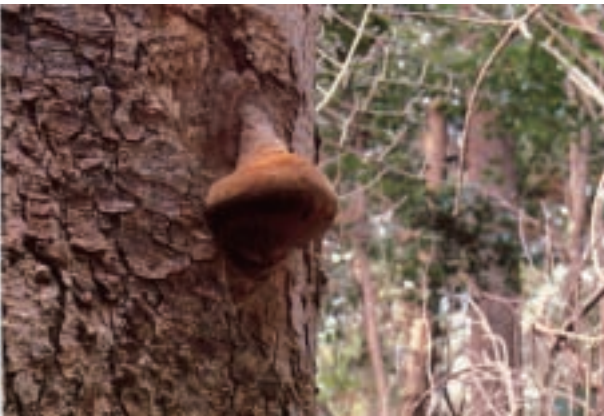
モミサルノコシカケ Phellinus hartigii