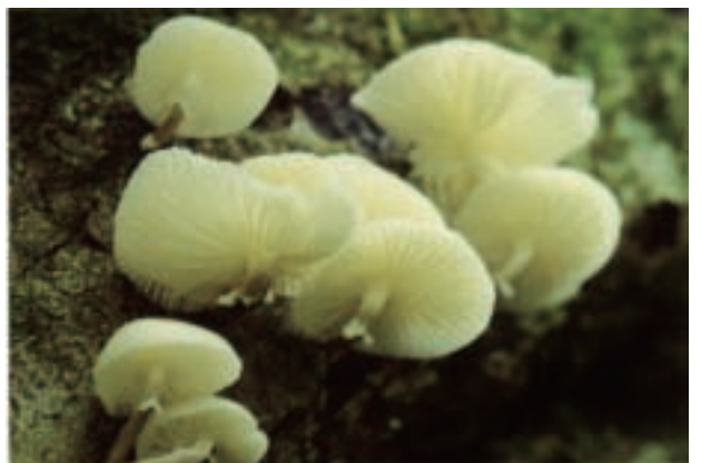
スメリツバタケモドキ Oudemansiella platyphylla (筑波山)