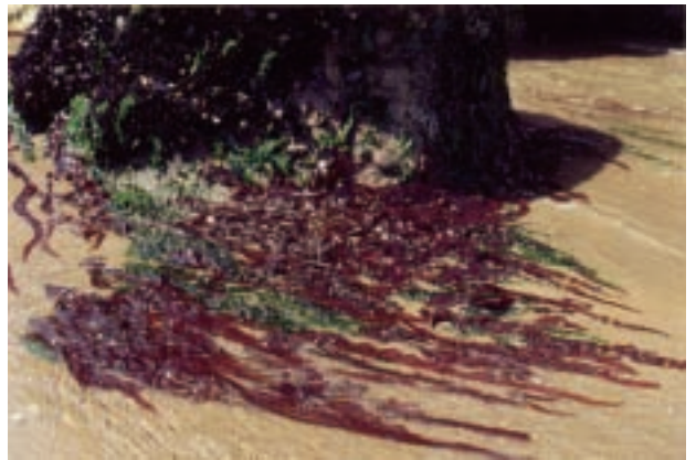
ヒヂリメン Grateloupia sparsa