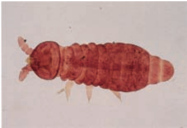
ツクバムラサキトビムシ (新種) Hypogastrura tsukubaensis