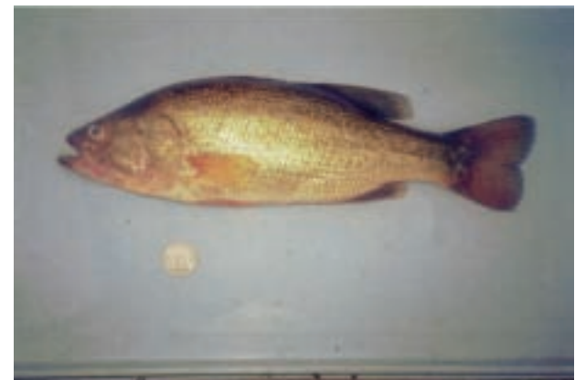
オオクチバス Micropterus salmoides