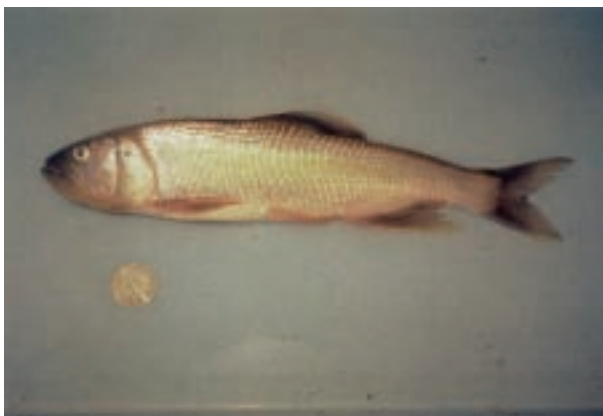
ハス Opsariichthys uncirostris