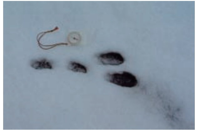
ノウサギ Lepus brachyurus (筑波山北斜面の林道上) (雪上につけられた足跡)