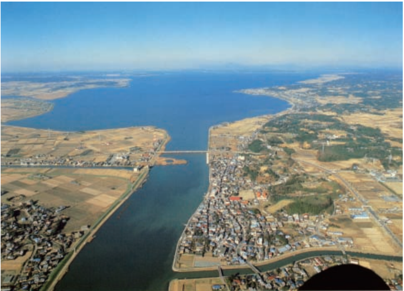
常陸利根川と霞ヶ浦