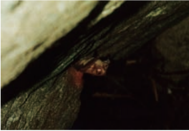
キタガシラコウモリ Rhinotophus ferrumequinum (筑波山南斜面)