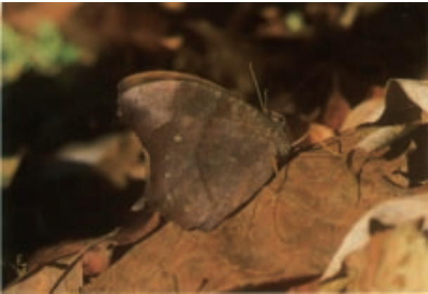
クロノマチョウ Melanitis phedima oitensis (真壁町羽鳥)