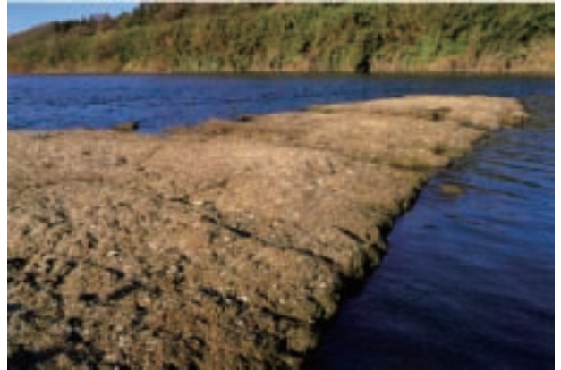
鬼怒川河床の貝化石