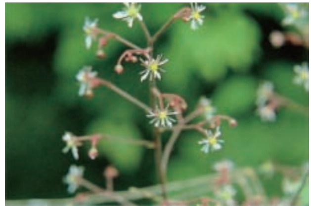
ホシザキユキノシタ Saxifraga stolonifera form. aptera