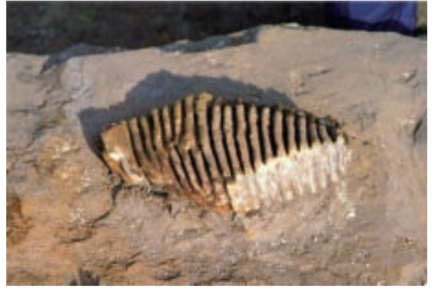
ナウマンゾウ白歯化石