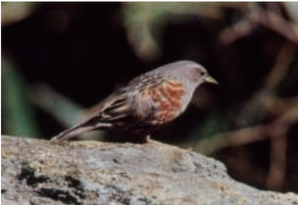
イワヒバリ Prunella collaris (筑波山)