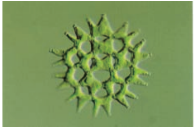
Pediastrum duplex var. duplex