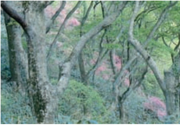
春のブナ林に咲くトウゴクミツバツツジ Rhododendron wadanum