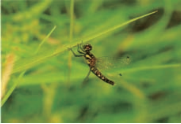
ハッチョウトンボ Nannophya pygmaea (真壁町)