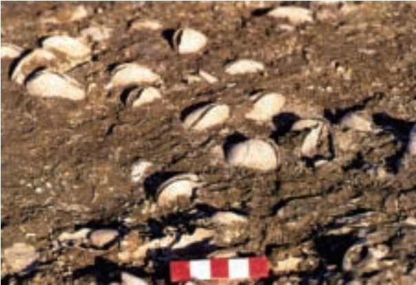
白生のウチムラサキ