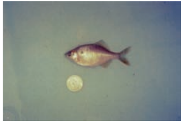
ゼニタナゴ Pseudoperilampus typus