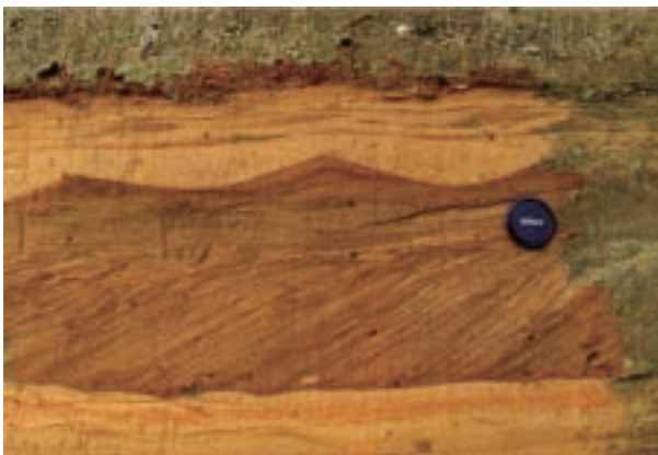
ウェーブリップル