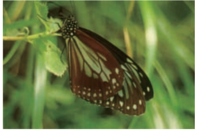
アサギマダラ Parantica sita nipponica (筑波山頂)