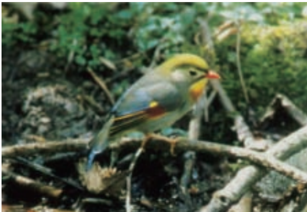
ソウシチョウ Leiothrix lutea (筑波山)