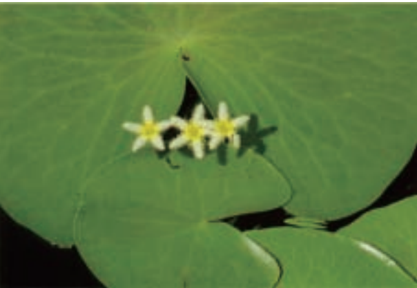
ガガブタ Nymphoides indica