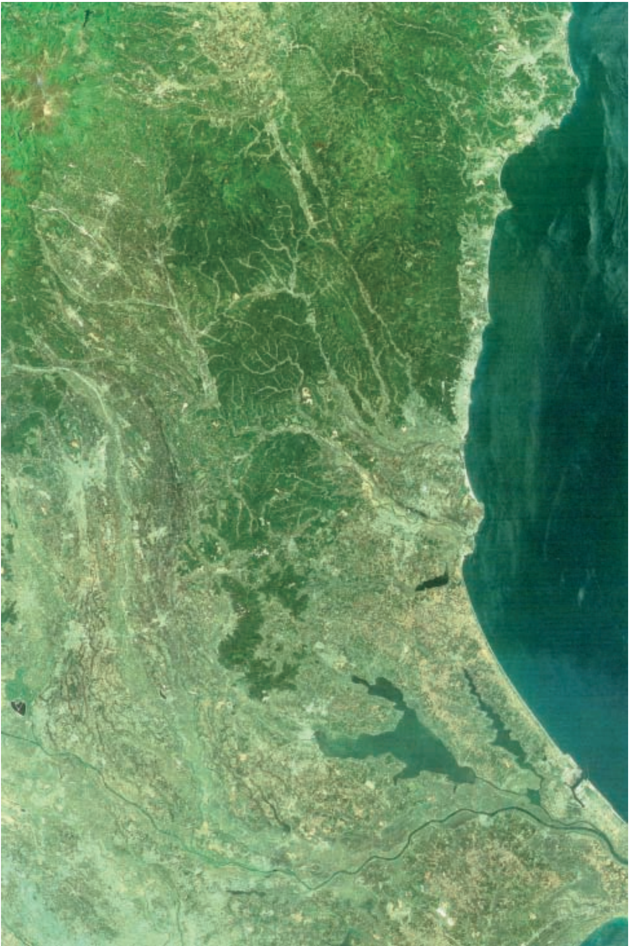
ランドサットから撮影した茨城の画像