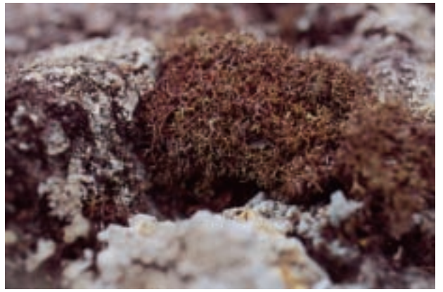
トゲシバリ Clodia aggregata