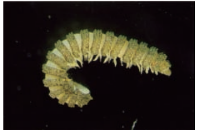
ハガヤスデ Ampelodesmus granulosis