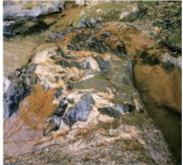
花崗岩中の捕獲岩 (真壁町湯袋峠)