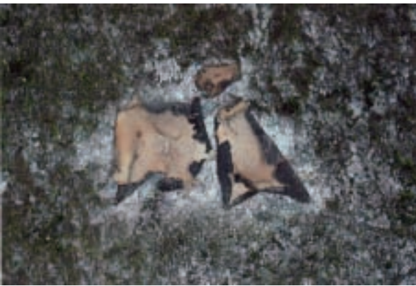
イワタケ Umbilicaria esculenta