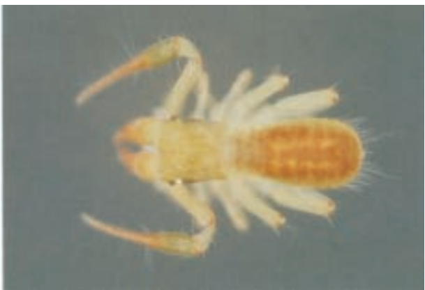
ムネトゲツチカニムシ Tyrannochthonius japonicus