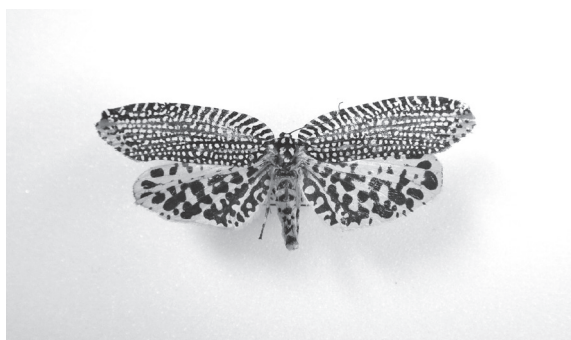
図2. ビロードハマキ Fig. 2. Cerace xanthocosma Diakonoff, 1950