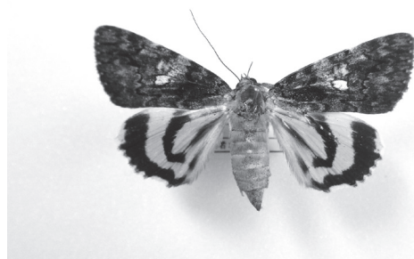
図5. フシキキシタバ Fig. 5. Catocala separans Leech, 1889

国のレッドデータブック (環境省自然環境局, 2015) では2014年時点で初めて準絶滅危惧種に指定されたが、筑波山では山麓のクヌギ林で毎年安定して発生している (図6).