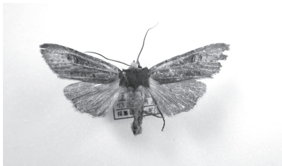
図4. ハネナガモクメキリガ Fig. 4. Xylena nihonica Höne, 1917