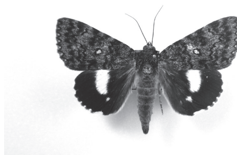
図6. コシロシタバ Fig. 6. Catocala actaea Felder & Rogenhofer, 1874