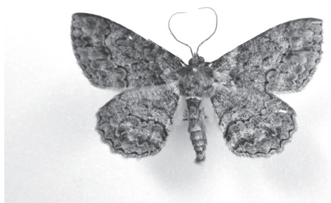
図3. ヒロバウスアオエダシヤク Fig. 3. Paradarisa chloauges Prout, 1927