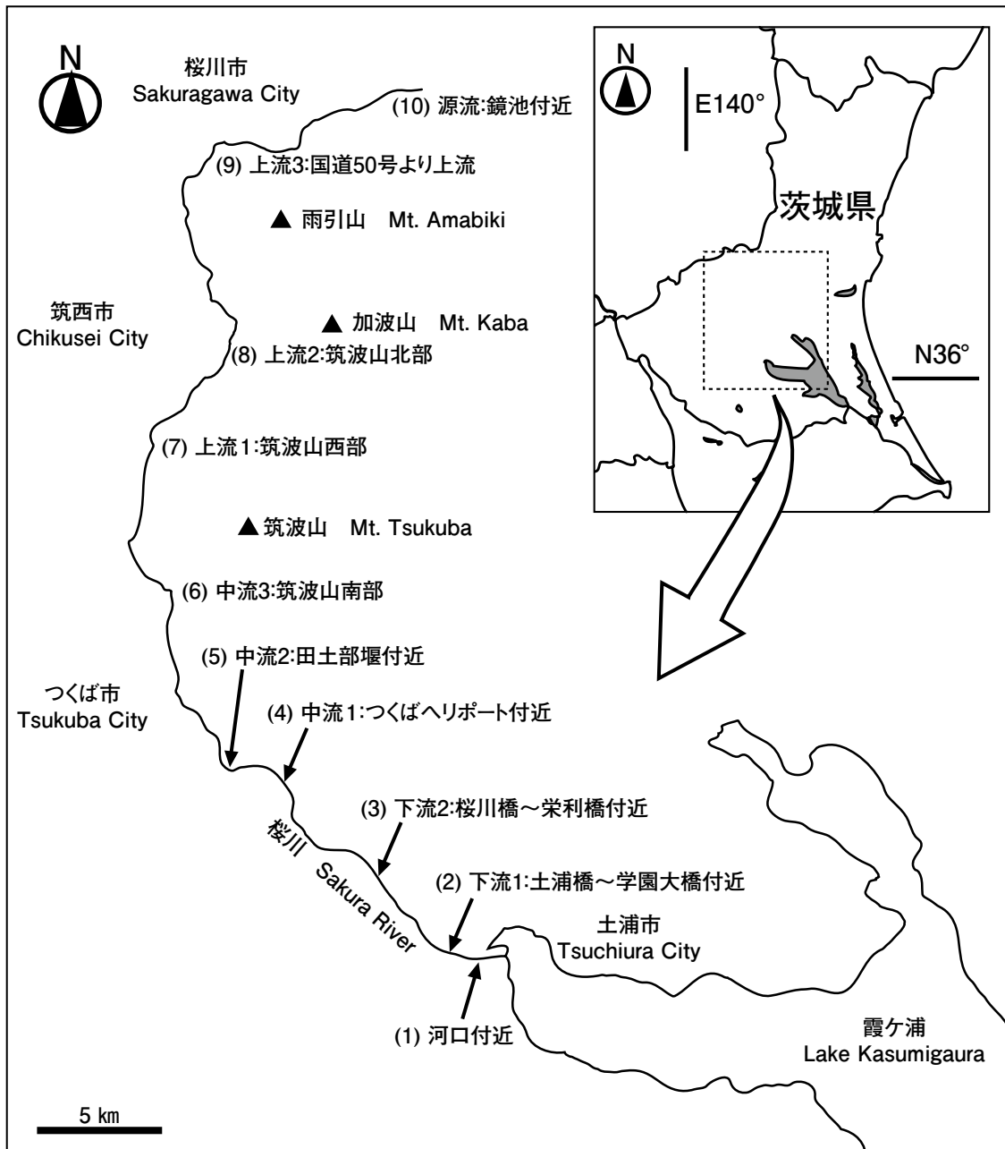
図1. 調査地. Fig. 1. Study area.

本研究は、図1に示した桜川全域を調査対象地域とした。調査地は、霞ヶ浦に注ぐ河口付近（土浦市蓮河原町、港町）から源流部（桜川市山口）まで、概ね均