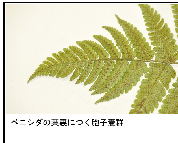
ベニシダの葉裏につく孢子嚢群

孢子嚢がついたシダ植物の葉、生物顕微鏡、双眼実体顕微鏡、シャーレ、柄付き針、エタノール、スライドガラス、カバーガラス、成熟した前葉体