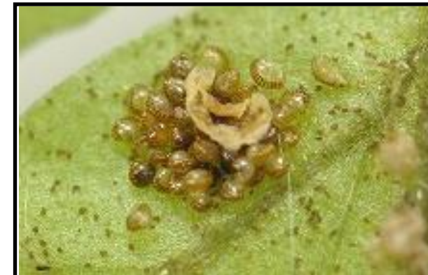
ベニシダの孢子嚢群の拡大