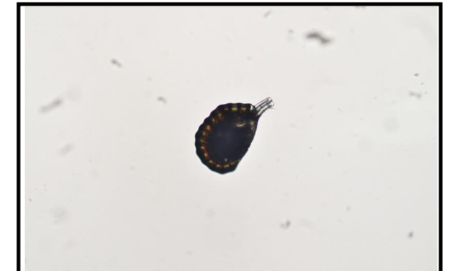
ベニシダの孢子嚢を取り出したところ