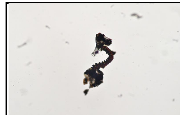
乾燥が進み、孢子嚢が開く