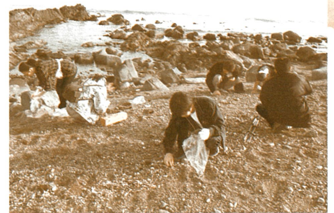
ジュニア学芸員による海辺の打ち上げ貝調査