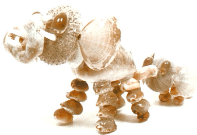
貝殻などでつくったゾウの親子