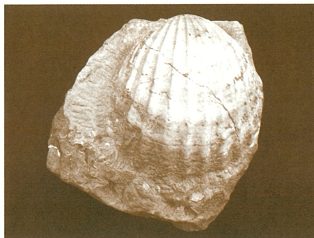
「思い出の一品」のタカハシホタテの化石