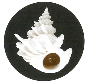
ニノミヤイトカケ (所蔵:千葉県立中央博物館)

貝は古くから人々にとって身近な生きもので、生活のなかでいろいろな形で利用されてきました。特に形態や色彩に富んだ貝殻は、世界各地で装飾品や工芸品などに使われ、現在でもコレクターたちの心をとらえてやみません。