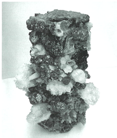
鉱山で働く人が鉱物でつくった花瓶