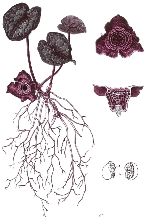
タマノカンアオイ

日本の固有植物の多くは限られた地域でのみ生きており、絶滅危惧植物に指定されているものも少なくありません。これらの植物の日本での絶滅は地球上からの絶滅を意味します。私たち日本人にとって、これらの植物は大切な宝といえるでしょう。