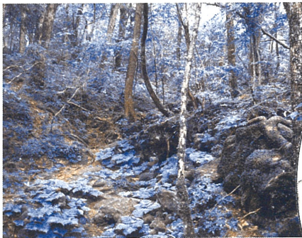
1 青木ヶ原樹海（上九一色村） 溶岩流の上にてきた森