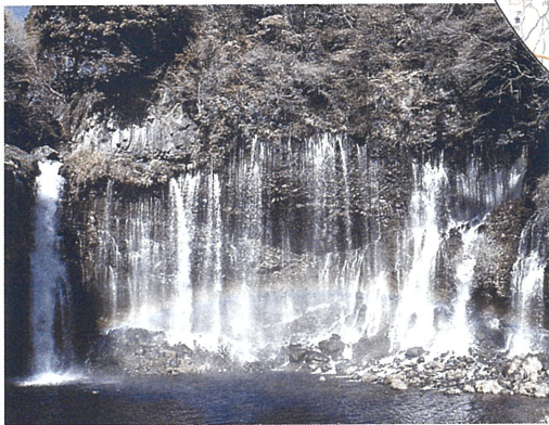
2 富士の恵み—白糸の滝— 溶岩層から湧き出す豊富な地下水