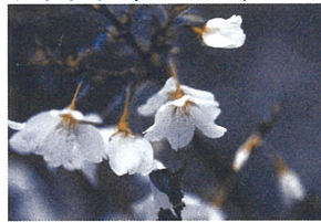
3 フジザクラ（マメザクラ）