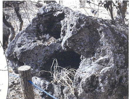
4 溶岩樹型（裾野市立富士山資料館所蔵） 溶岩流に残された樹木の跡