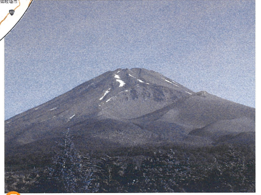
5 宝永火口（裾野市） 300年前の噴火は富士山中腹で起こった