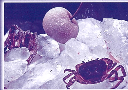
「やまなし」より イワテヤマナシ(レプリカ)とサワガニ