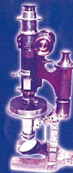
賢治が採集した蛇灰岩と当時の偏光顕微鏡 (所蔵:岩手大学農学部農業教育資料館)