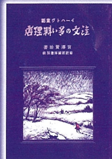
イーハトヴ童話 「注文の多い料理店」 初版本 (所蔵:林風舎)